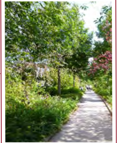
UNE ZONE DE PROMENADE À L'OMBRE Paris