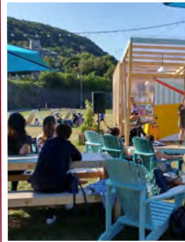
DES ZONES DE RENCONTRE Montréal