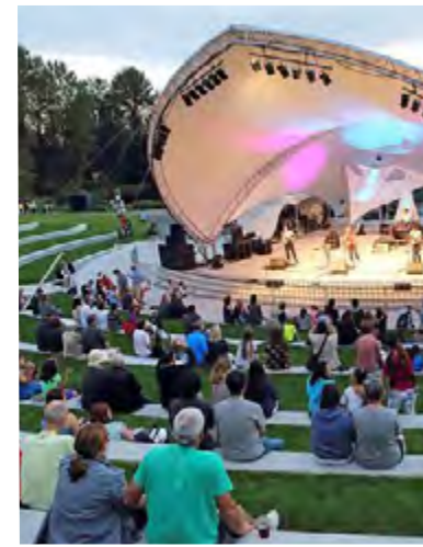
DES CONCERTS EN PLEIN AIR Montréal