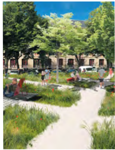
UN ESPACE VERT DE DÉTENTE ÉCOLOGIQUE Dijon (à gauche) & le Mans (à droite)