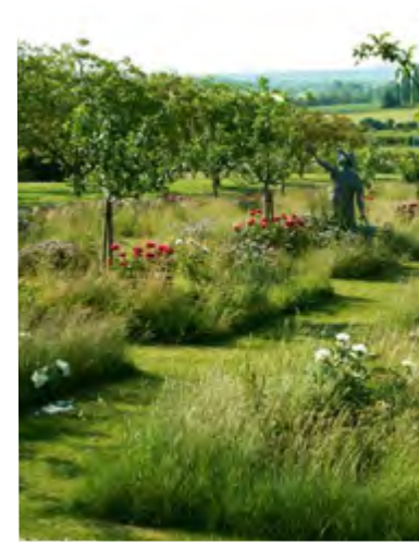
UN VERGER URBAIN ÉCOLOGIQUE Ixelles